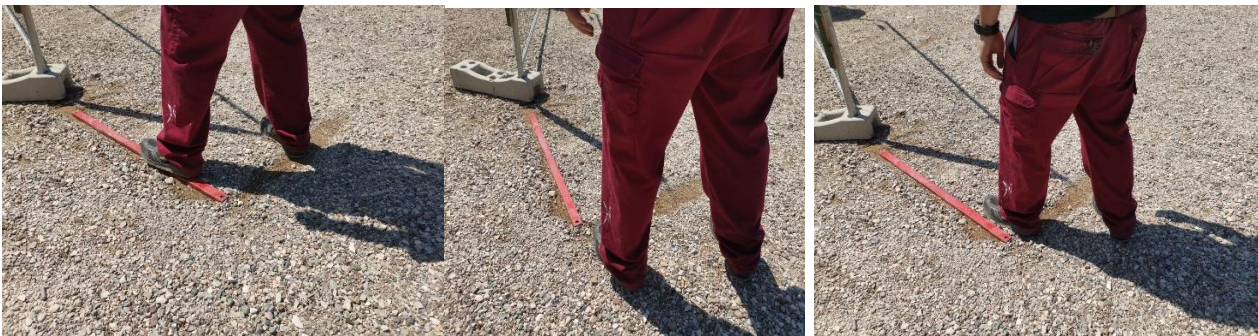
Fig.3: In figura alcuni esempi di posizioni di tiro

Domanda: Quale deve essere la posizione del tiratore (fig.3)? In quali casi è PE?